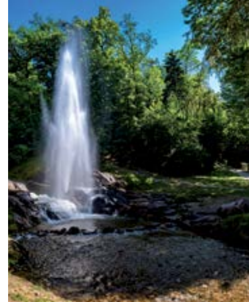
Gerbe d'eau du Lac de Saint-Ferréol.