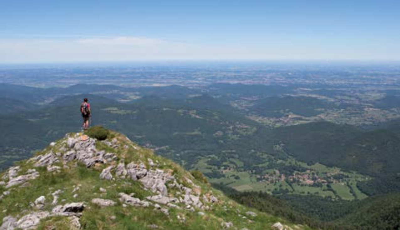
Aspet vu du Pic du Gar.