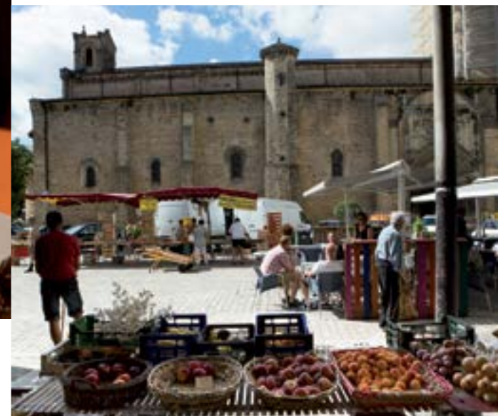
Marché à Saint-Gaudens.

À Bellegarde Sainte-Marie , la ferme de la Come fabrique un cidre made in Sud Ouest. Pour une vraie couleur locale, osez le cidre vieilli en fût d'Armagnac. La Come, c'est aussi un lieu culturel où sont organisés des concerts.