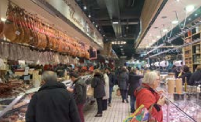
Marché Victor Hugo.

se laisse aussi déguster transformée en merveilleux bonbons cristallisés et en liqueur pour un apéritif raffiné « bulles et violette ».