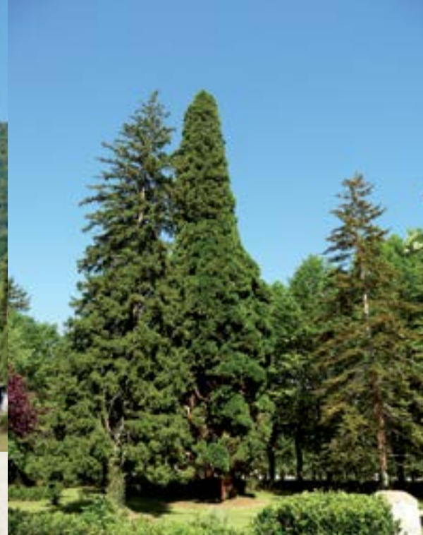
Parc de Barbazan.

POINT DE DÉPART RECOMMANDÉ Saint-Bertrand-de-Comminges