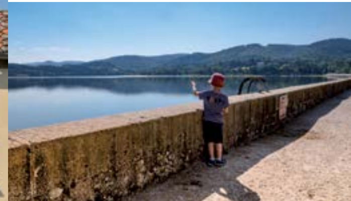
Digue du lac de Saint-Ferréol.

À Port-Lauragais, se trouve la Maison de la Haute-Garonne, un Espace Tourisme avec une boutique d'artisanat et de produits locaux mais également une belle exposition sur les origines et l'histoire de la construction du canal du Midi et de son génial concepteur, Pierre-Paul Riquet.