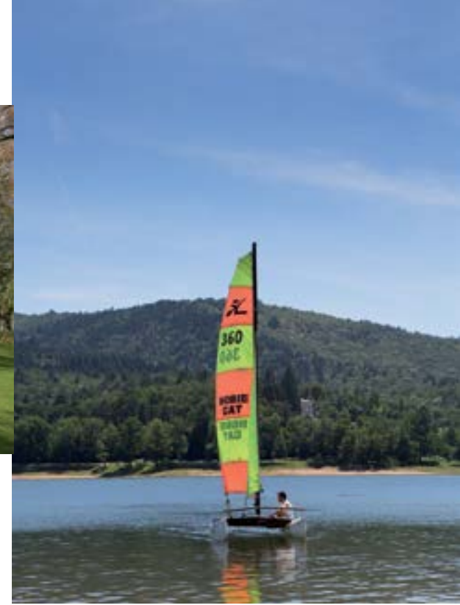
Voilier sur le lac de Saint-Ferréol.

Au départ de Toulouse voici la Vélo Voie Verte le long du canal du Midi qui offre aux voyageurs en quête de tourisme vert, des balades adaptées pour circuler en sécurité avec un décor unique, allées de platanes, péniches, villages pittoresques, maison éclusières... Cet itinéraire cyclable qui relie l'Atlantique à la Méditerranée, est inscrit au patrimoine mondial de l'Unesco. V80, axe des canaux, canal du Midi, canal de Garonne, Rigole de la plaine.