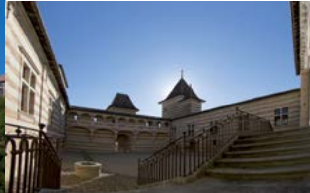
Château de Laréole.