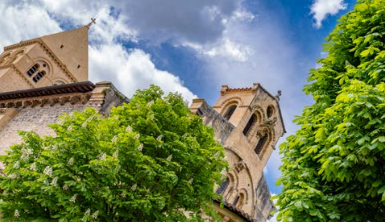
Collégiale de Saint-Gaudens.