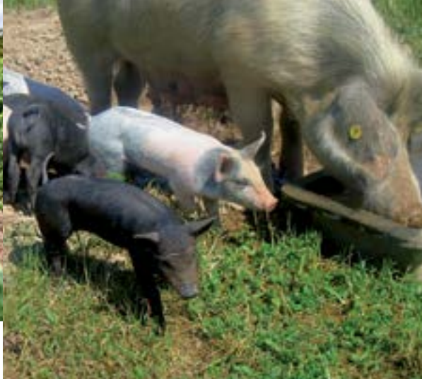
Porcs - Ferme Bio Bretx.