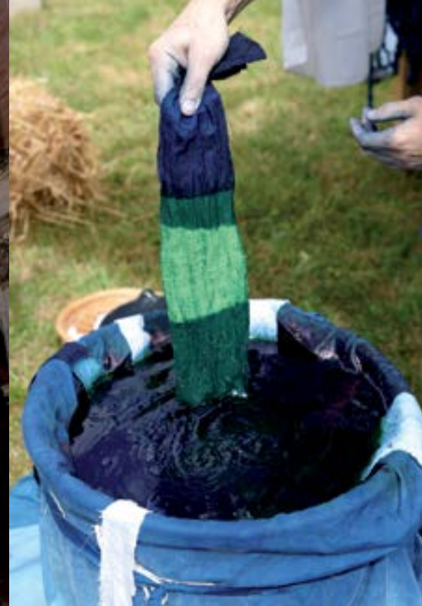
Teinture du pastel.

POINT DE DÉPART RECOMMANDÉ Loubens-Lauragais