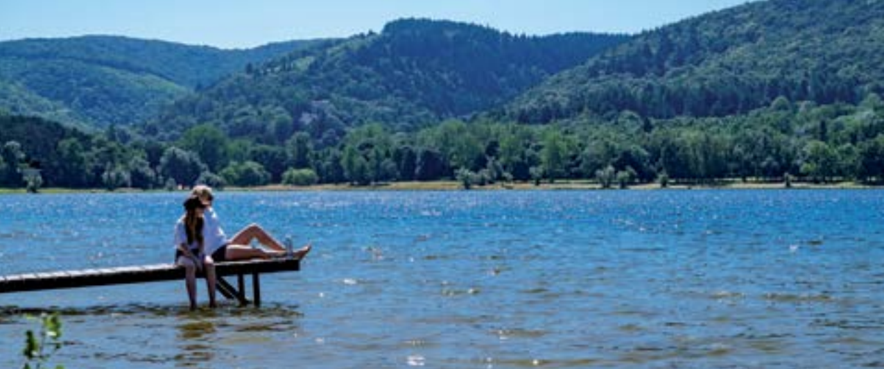
Lac de Saint-Ferréol.