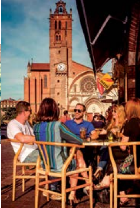
Bon vivre Place Saint-Étienne.