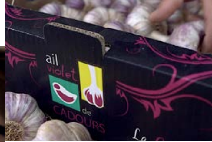
Ail Violet de Cadours.

Rendez vous à la Maison des vins (Fronton) et à la cave coopérative Vinovalie.