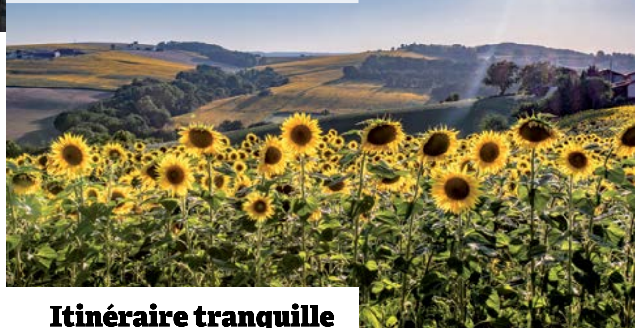
Champs vallonnés du Lauragais.

D'un bout à l'autre du département, la beauté et la silhouette des paysages invite à prendre son temps et à goûter l'instant présent.