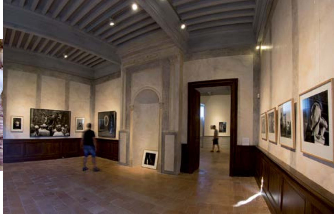
Château de Laréole.

En passant à Saint-Cézert sur le chemin de Larra, on peut admirer le clocher-mur à pignon triangulaire de l'église puis rejoindre Launac où de belles découvertes attendent dans le parc du village : les vestiges de l'Orangerie où on cultivait jadis des espèces rares et une île où il fait bon se promener.