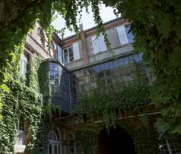
Cour intérieure d'un hôtel particulier.