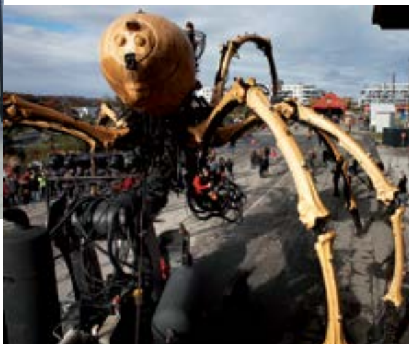
La Piste des géants.