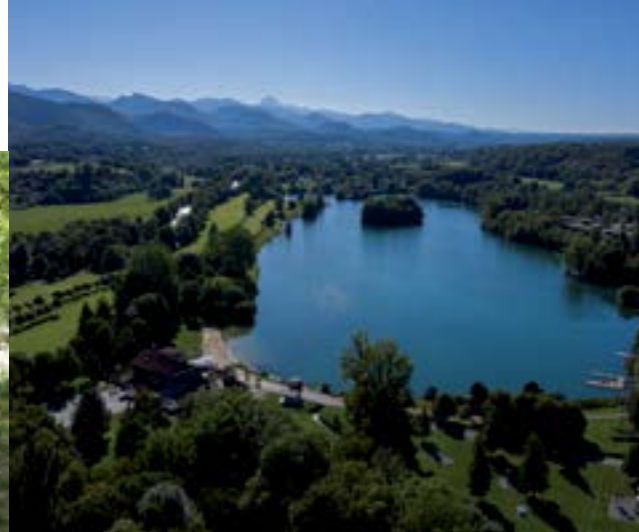
Lac de Montréjeau.