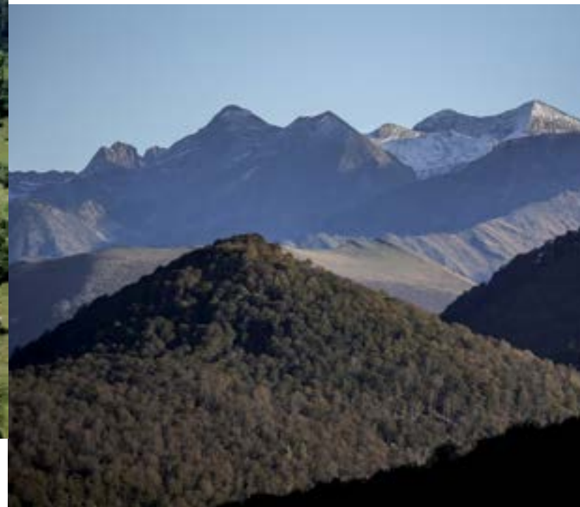
Col du Portet d'Aspet.

Avec 25 arrivées et 30 départs de la Grande Boucle, Luchon est « LA » ville star du Tour en Haute-Garonne. Avant de rejoindre le Val d'Aran et l'Espagne en passant par le col du Portillon (1 293 m), il faut absolument s'accorder du temps dans les thermes de Luchon et son hammam naturel implanté au cœur d'une grotte à 40° découverte par les Romains.