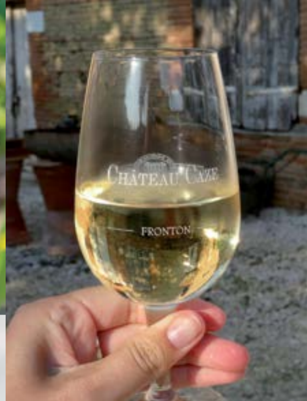
Vin blanc de Fronton.