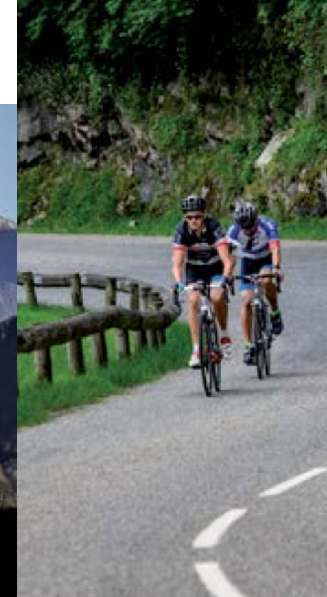
Cyclistes grim pant un col des pyrénées.

Depuis le col de Menté, cap vers Coulédoux et Portet-d'Aspet, dernier village avant l'Ariège où une halte au bar-restaurant s'impose. En pleine nature, retour vers Juzet-d'Izaut et le col des Ares.