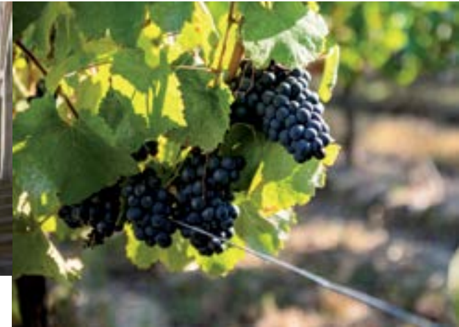
Vignoble de Fronton.

À l'ouest de Toulouse, il faut absolument visiter le château de Laréole . Entouré d'un parc, le château du XVI e est un petit bijou d'architecture renaissance. Ouvert gratuitement en saison estivale, notre conseil : profitez des spectacles ! Pour dormir, l'aire de Grenade vous accueille ce qui vous donnera aussi l'occasion de visiter cette ancienne bastide pleine de charme.