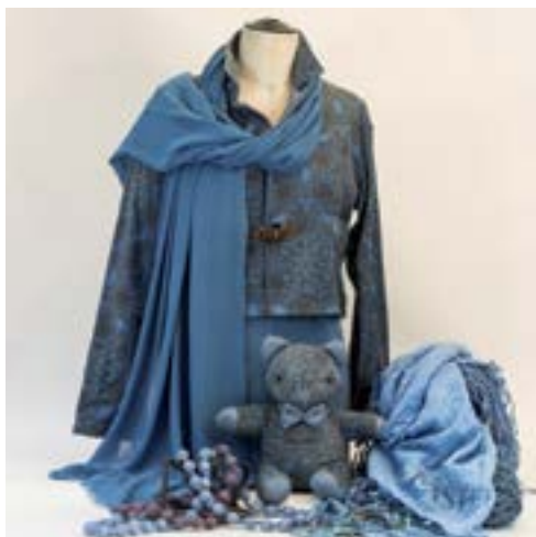
AHPY Créations, Pastel.