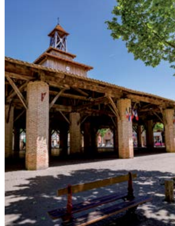
La bastide de Grenade.

Son calibre, sa robe ivoire aux stries violacées et son goût inimitable ont valu une Appellation d'Origine Protégée (AOP) à l'ail violet de Cadours. Le mercredi matin de juillet à septembre, il s'arrache sur le marché et les producteurs le vendent en direct en vrac ou en tresses avant de le célébrer à la fin de l'été dans une grande fête. Au sortir de Cadours, la silhouette bigarrée de brique et de pierre du château de Laréole ne peut qu'attirer l'œil ! Cette ancienne résidence de campagne de style Renaissance appartenait à un négociant de pastel et a été rénovée par le Conseil départemental. À la belle saison, elle accueille spectacles et expositions dans le cadre du très couru festival 31 Notes d'été . Et plus loin le moulin de Brignemont a retrouvé une seconde jeunesse grâce à un meunier passionné qui a relancé l'activité. Visitable de mi-juillet à fin août avec farine moulue à la clé, il charme par son authenticité et par ses mécanismes en parfait état de marche.