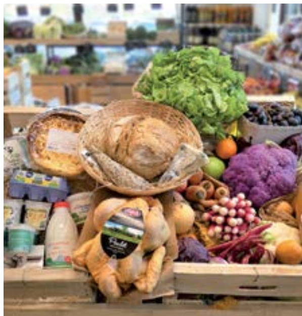
Minjat! à Colomiers.

À Colomiers , Minjat, marché local et cantine, ici les créateurs du concept ont fait le pari suivant « Le bien-manger local accessible à tous » ! L'enseigne rassemble près de 200 producteurs locaux, à découvrir absolument !