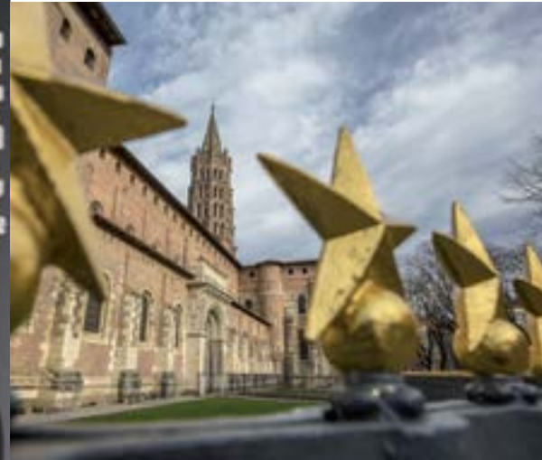
La basilique Saint-Sernin.