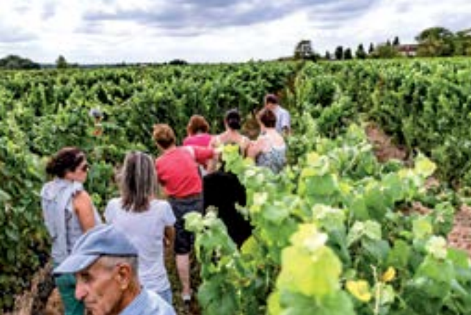
Vendanges dans le Frontonnais.