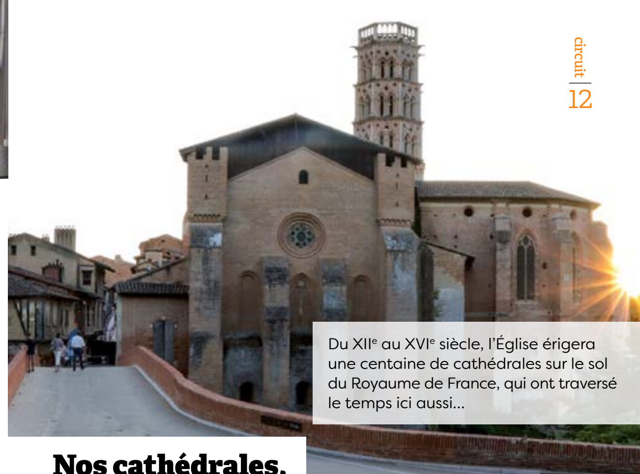
Cathédrale de Rieux-Volvestre.

Ce périple consacré au pastel peut se terminer en pleine campagne et en beauté au château de Laréole (XVI e siècle), où se déroule chaque été un intéressant programme de concerts et d'expositions, près du magnifique parc à la Française aménagé au XVIII e siècle. La demeure, propriété du Conseil départemental, est le fruit du travail de l'architecte Dominique Bachelier – également concepteur de l'Hôtel d'Assézat à Toulouse – pour le compte du marchand pastelier Pierre de Cheverry.