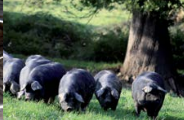
Porc noir de Bigorre.

Cette filière est en plein développement dans notre région et particulièrement en Haute-Garonne où peu à peu ces cultures oubliées d'orge, de houblon et de malt s'imposent pour fournir des brasseurs de plus en plus nombreux.