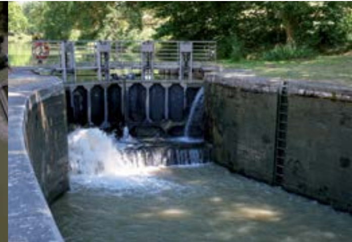
Écluse de Montesquieu-Lauragais.

Les vestiges du château fort du XI e siècle, les maisons à colombages et demeures des XVII e et XVIII e siècles apportent le témoignage du riche passé historique du village. Il fut notamment le théâtre d'un épisode tragique de la résistance cathare face à l'Inquisition en 1212. À proximité, le Seuil de Naurouze partage les eaux vers la Méditerranée ou l'Atlantique.