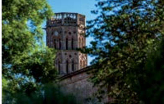
Le clocher de la cathédrale de Rieux-Volvestre.