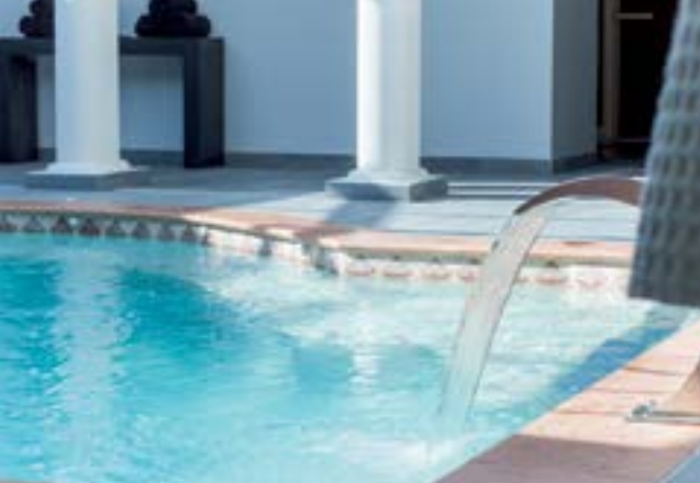
Spa à Terre de Pastel.

et femmes de passion qui nous livrent un univers raffiné à travers plusieurs gammes de cosmétiques, ateliers de teinture, objets d'art.