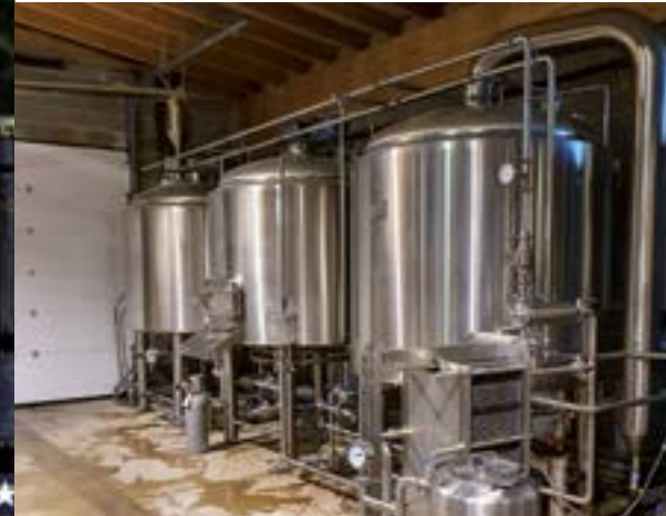
Brasserie de la Seillonne.