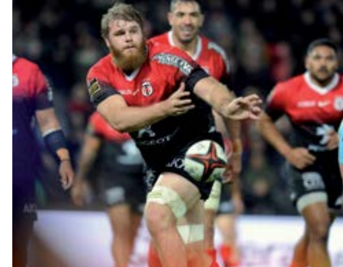
Technique de la passe.

Et oui le rugby se joue aussi à 13 joueurs et il est appelé « le rugby league » dans les pays anglophones. Il a été introduit en France dans les années 30, aujourd'hui il existe plus de 100 clubs de rugby à 13 sur le territoire et le Racing Club Saint-Gaudens fait partie des meilleurs ! Bar-Restaurant le Carré, 4 pl. Hippolyte , pour les retransmissions. Bonne table.