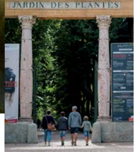
Le Jardin des Plantes.

Situé sur le grand rond-point d'où s'élancent les allées Jules-Guesde, François Verdier, Paul Sabatier et Frédéric Mistral, il fait figure d'îlot de verdure à la croisée des chemins. Depuis une autre passerelle on peut rejoindre le jardin Royal (premier jardin public créé à Toulouse en 1754) aménagé à l'anglaise depuis 1861. On y trouve également des statues érigées en l'honneur des pionniers de l'Aéropostale et des essences rares.