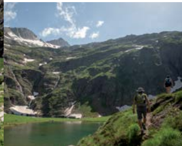
Le lac Vert.