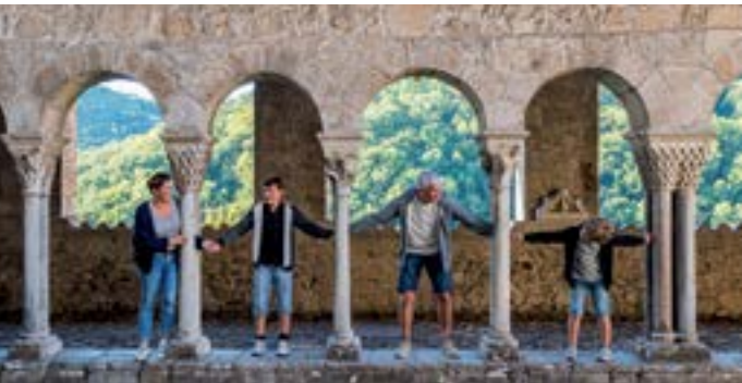
Cloître de la cathédrale Saint-Bertrand-de-Comminges.