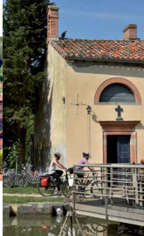
Écluse de Négra.

À Montesquieu-Lauragais, une jolie chapelle dédiée aux bateliers et l'écluse de Négra seront l'occasion de vous octroyer une petite pause. Le port de Gardouch, un peu plus loin, vous surprendra par son alignement de maisons colorées.