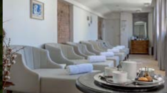
La Cour des Consuls.

Réputée et utilisée depuis la préhistoire, la fleur de pastel a fait la richesse de l'Europe occidentale de l'Antiquité romaine au XVI e siècle. Celtes et Gaulois l'utilisaient pour bleuir leurs tissus, se colorer les cheveux, mais aussi pour se couvrir le visage et le corps afin d'effrayer leurs ennemis !