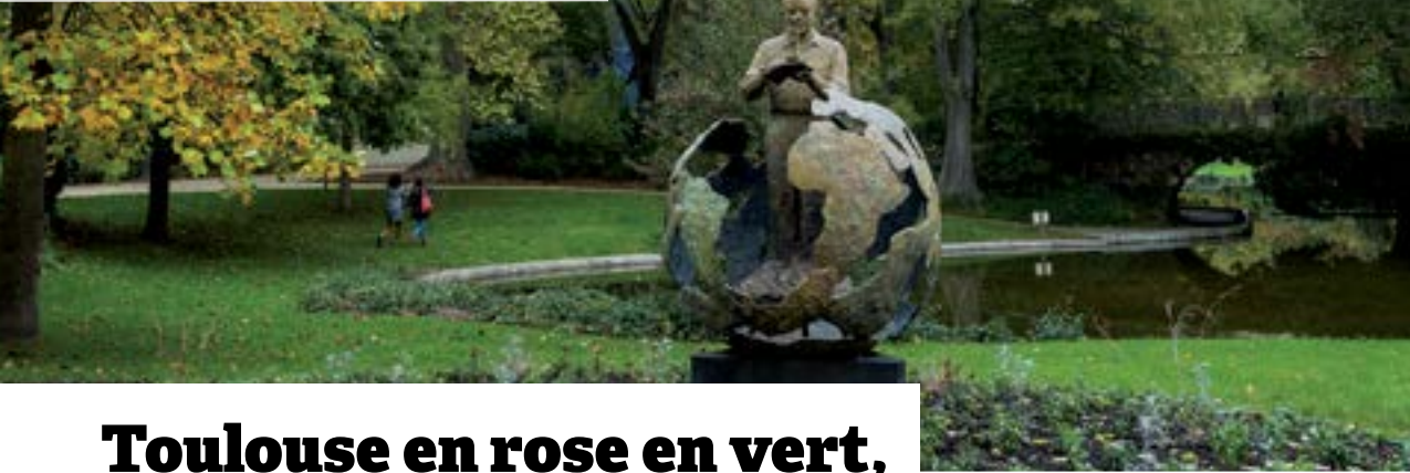
Le Jardin Royal.

La Ville rose passe au vert et son effervescence se transforme en bulles d'air dans ses parcs et jardins.