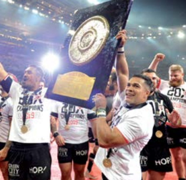
Bouclier de Brennus.