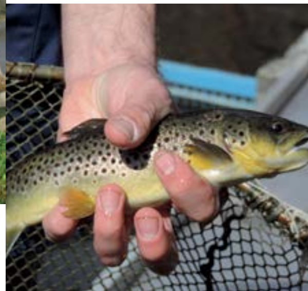
Truite - Viviers du Comminges.