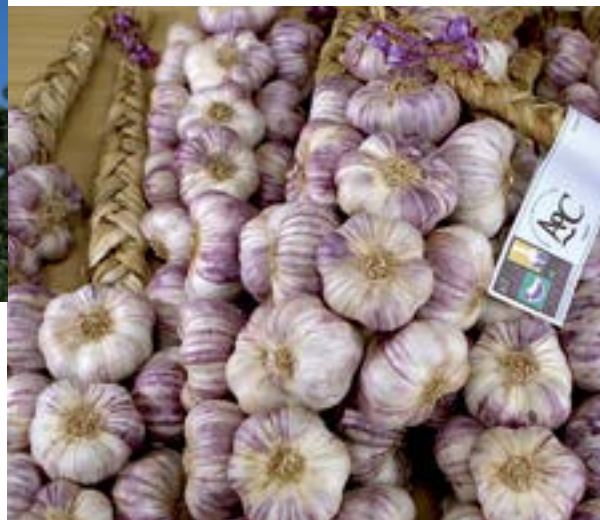
L'Ail Violet à Cadours.