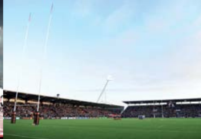
Stade Ernest Wallon.

Le Haka corner , (47 bd Lascrosses) avec diffusion de matchs pour rentrer dans l'univers du joueur Byron Kelleher.