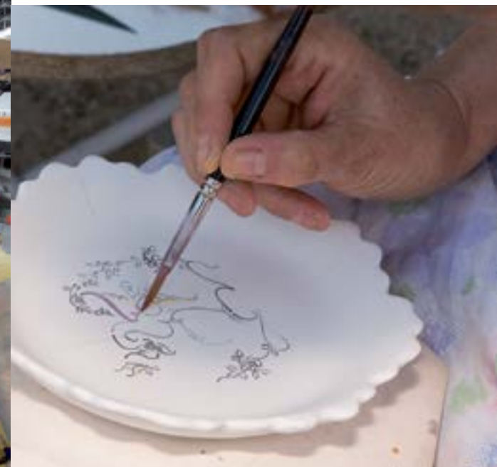
Faïencerie à Martres-Tolosane.