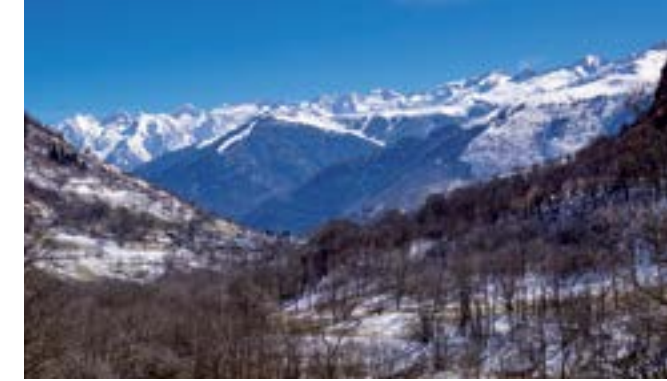
Port de Balès.

À la sortie de Bossost, prenez sur votre droite la direction du col du Portillon. Emprunté par les évadés, ces derniers partaient du Luchonnais pour traverser la frontière située en haut du col. Les chemins utilisés ne passaient que par la montagne. En effet, un poste de Kommandantur était situé à Luchon. Il est également intéressant de citer un autre moment important de l'Histoire : la Retirada, exil espagnol en 1936 qui va continuer jusqu'en 1939. Les républicains