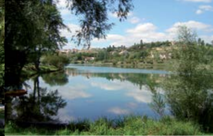
Lac de Thésauque.