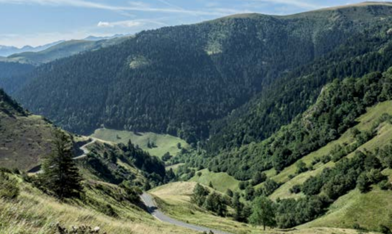
Port de Bales.