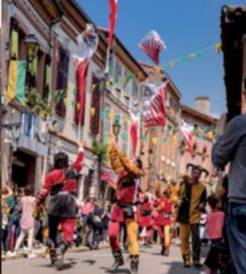
Fêtes traditionnelles du Papogay.