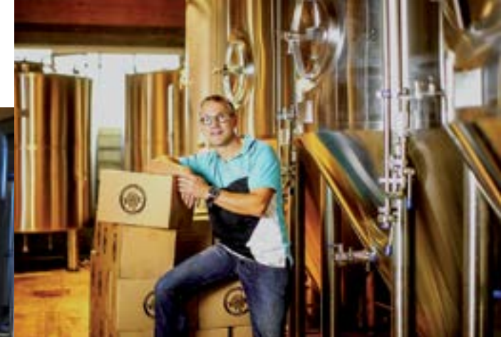
Brasserie de la Seillonne.