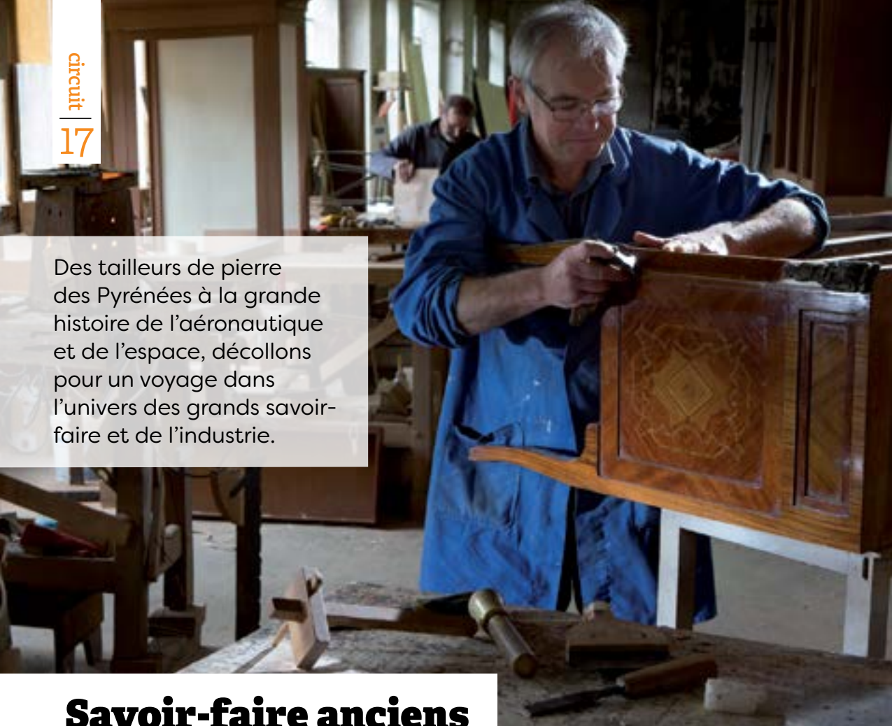
Marqueterie à Revel.

Des tailleurs de pierre des Pyrénées à la grande histoire de l'aéronautique et de l'espace, décollons pour un voyage dans l'univers des grands savoir-faire et de l'industrie.