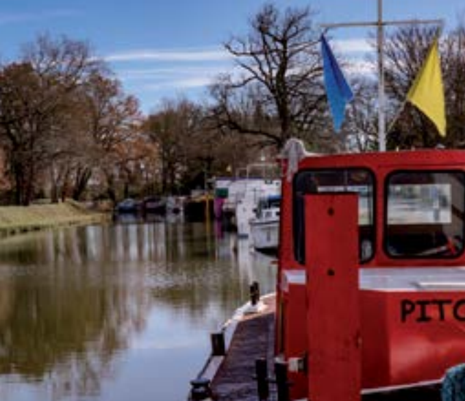
Port de Gardouch.