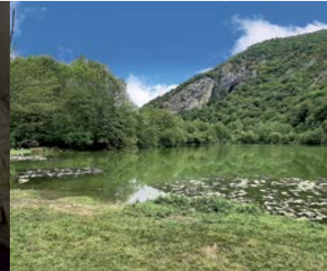
Lac de Saint-Pé-d'Ardet.