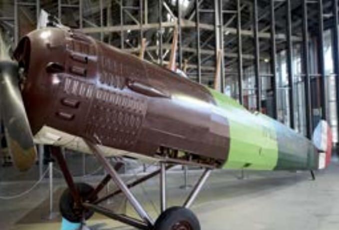
L'Envol des pionniers.