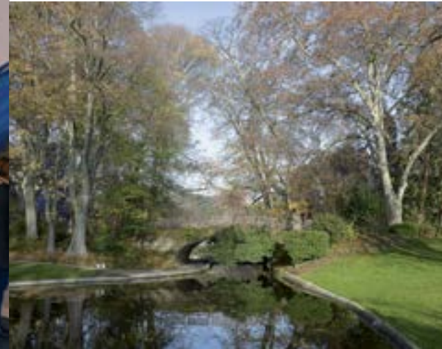
Jardin Royal à Toulouse.