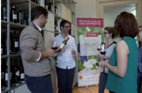
La Maison des vins.