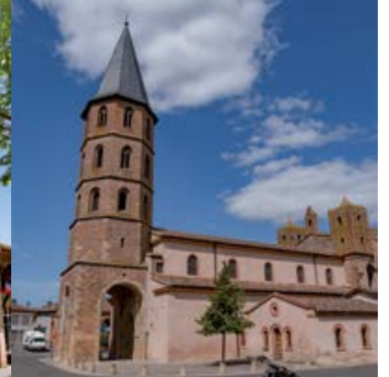
Église de L'Isle-en-Dodon.

Marquée par le catharisme, le commerce du pastel et même par la comtesse de Ségur dont Camille et Madeleine les personnages des « Malheurs de Sophie » reposent ici, la ville a conservé le charme suranné des temps anciens. De belles ruelles médiévales bordées de maisons à colombages, un immense château et un superbe point de vue.