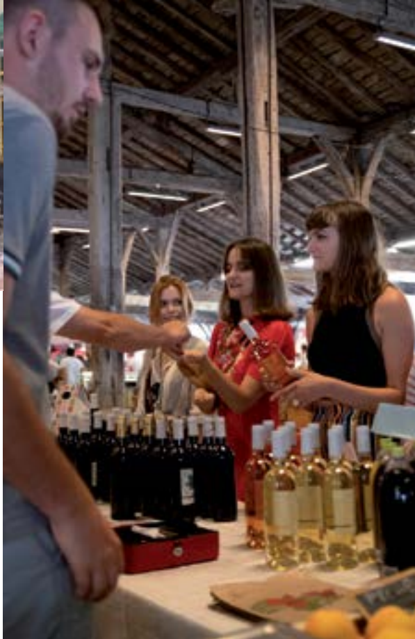
Marché sous la halle de Revel.

En repartant vers Toulouse, la Maison de la Haute-Garonne sur l'aire de Port-Lauragais est la vitrine de la Haute-Garonne, c'est là que vous trouverez le nec plus ultra des produits Haut-Garonnais, sélection de nos meilleurs producteurs et conseils avisés.