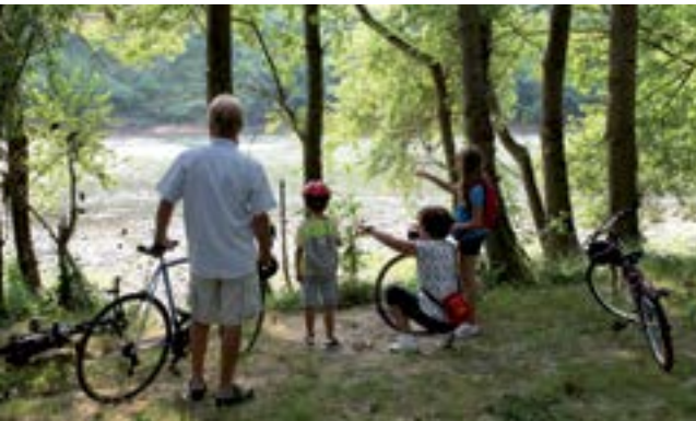
Balade à vélo en bord de Garonne.