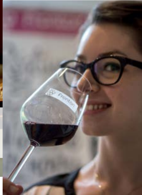
Dégustation de vin de Fronton.