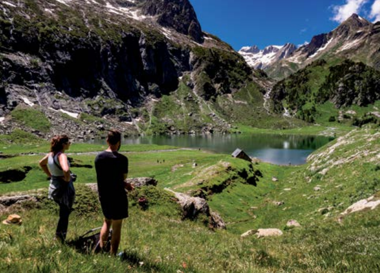
Le lac et le refuge d'Espingo.