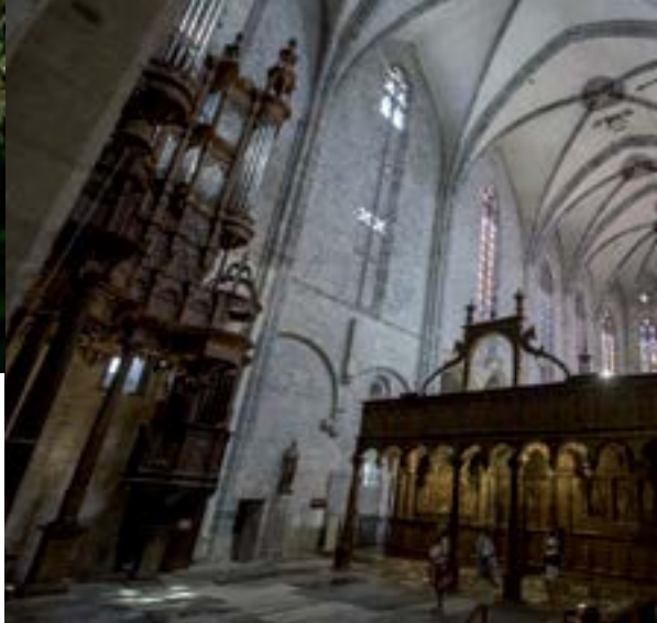
L'orgue de la cathédrale de Saint-Bertrand de-Comminges.

Pour la nuit, l'arrêt incontournable est la base de loisirs d'Auzas. Un moment rare !