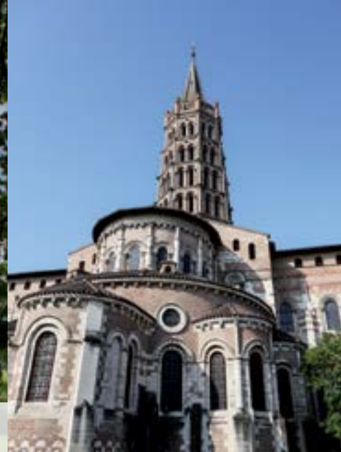
La basilique Saint-Sernin.