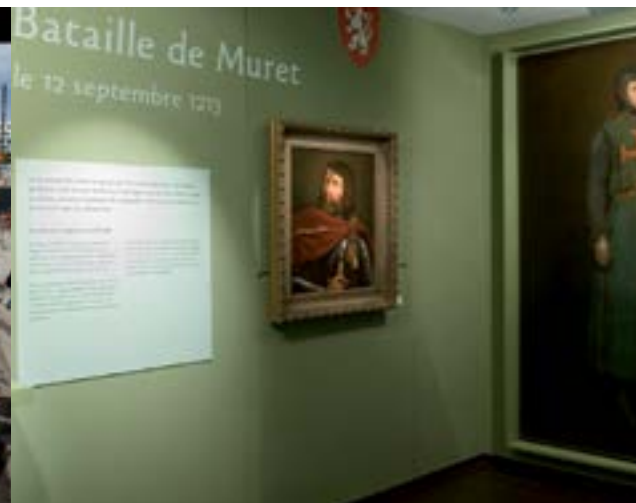
Musée Clément Ader.