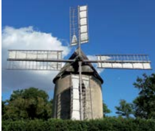
Moulin de Brignemont.