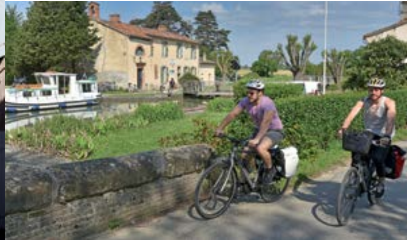
Écluse de Négra.