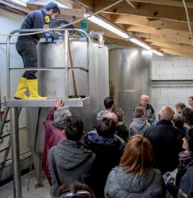
La Bierataise - Brassage public.