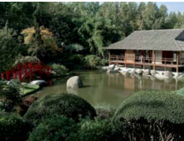
Le Jardin Japonais.