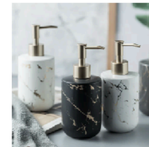
Ceramic Soap Dispenser