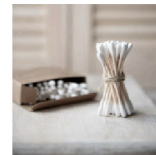
Bamboo Cotton Swabs