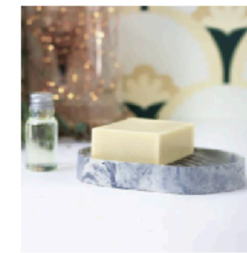
Concrete Soap Holder