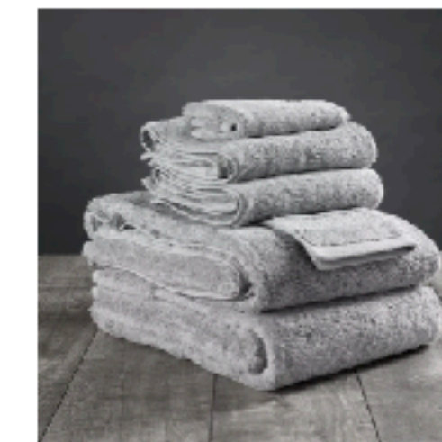
Eco-Friendly Cotton Towels